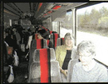
Groupe dans l'autobus

LA PUBLICATION DE CE BULLETIN EST UNE GRACIEUSE DE VOS DEUX CAISSES DESJARDINS À LA TUQUE