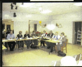
CA du CSSSHM Salle communautaire à Parent